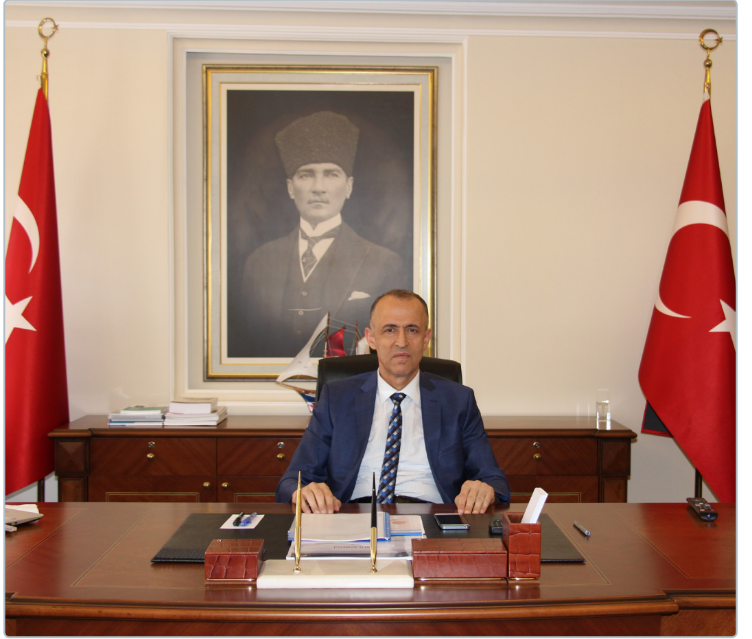
Hamdi Bilge AKTAŞ VALİ